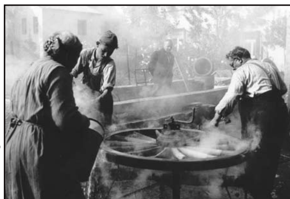
Der junge Bursche hilft bei der Herstellung eines Wagenrades