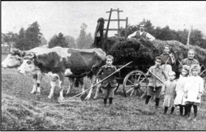
Kinder bei der Heuernte