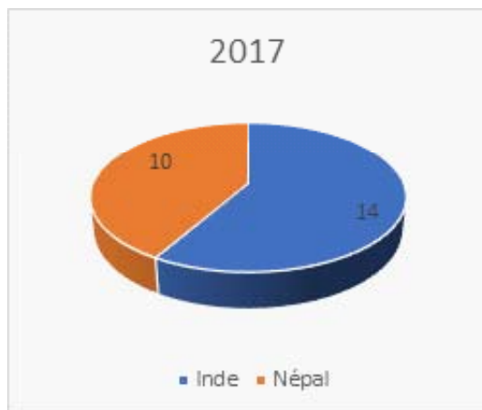
Nombre de projets sous accord-cadre gérés par pays en 2017

Les 24 projets soutenus sont mis en œuvre par 29 associations locales indiennes, réparties sur 8 Etats différents, et 10 associations au Népal, réparties sur 15 districts.